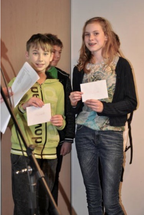
De Souburgse prijswinnaars

wel zijn dame te redden maar niet de partij: na 2 .., Te2+ 3. Kd1, Td8+ ging hij mat. Aangezien Zofyra duidelijk de meeste weerstandspunten had, kreeg zij de 50 Grand Prix-punten en moest Vincent met 45 punten genoeg nemen. Het prijzengeld werd zoals gebruikelijk wel netjes gedeeld. Ook Roan Verhage speelde in de C-groep, hij eindigde op 2 uit 7.