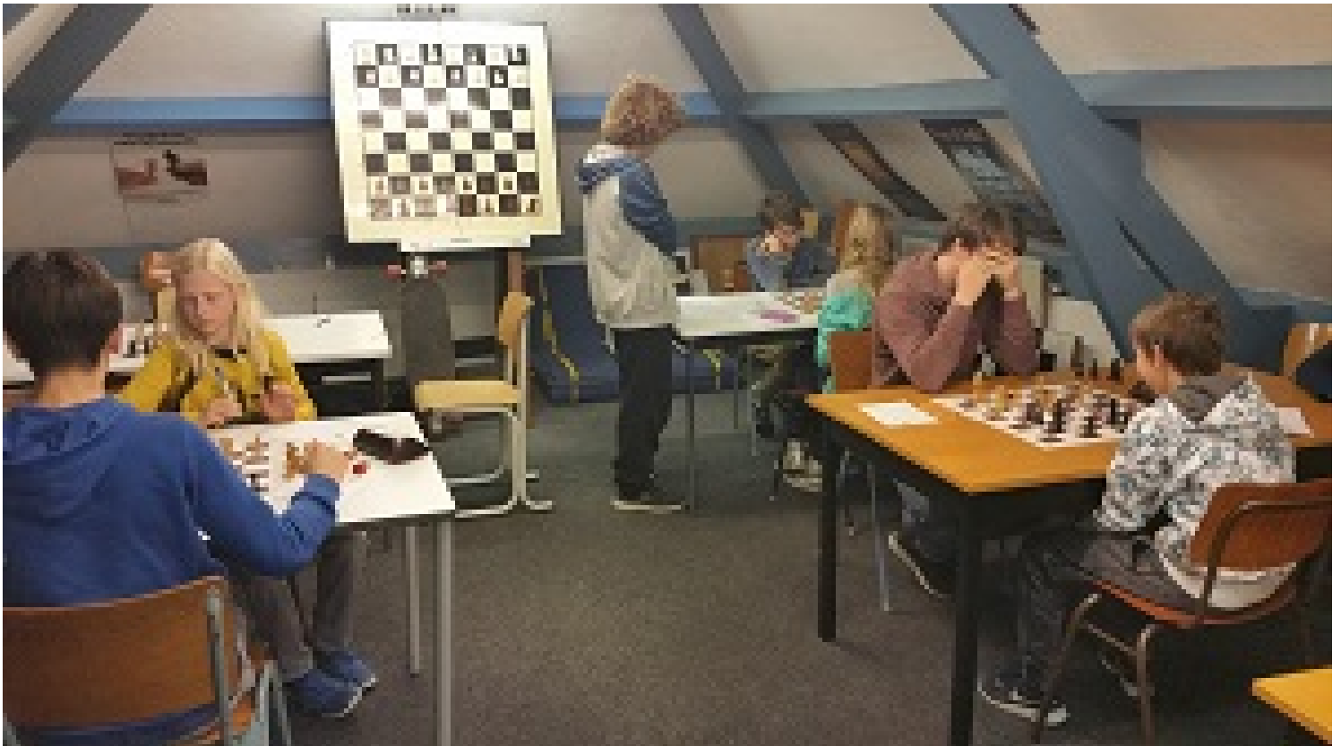
De A-groep bezig aan de 21e ronde (Sjoerd wilde niet op de foto)

Vincent kwam vanuit de opening in een middenspel terecht waarbij hij 2 paarden en torens had en tegenstander Sjoerd het loperpaar met torens. Op zich zouden de lopers sterker moeten zijn, maar Sjoerd besloot om er één af te ruilen. Daarna was Vincent handiger met zijn stukken en kon hij de overwinning bijschrijven.