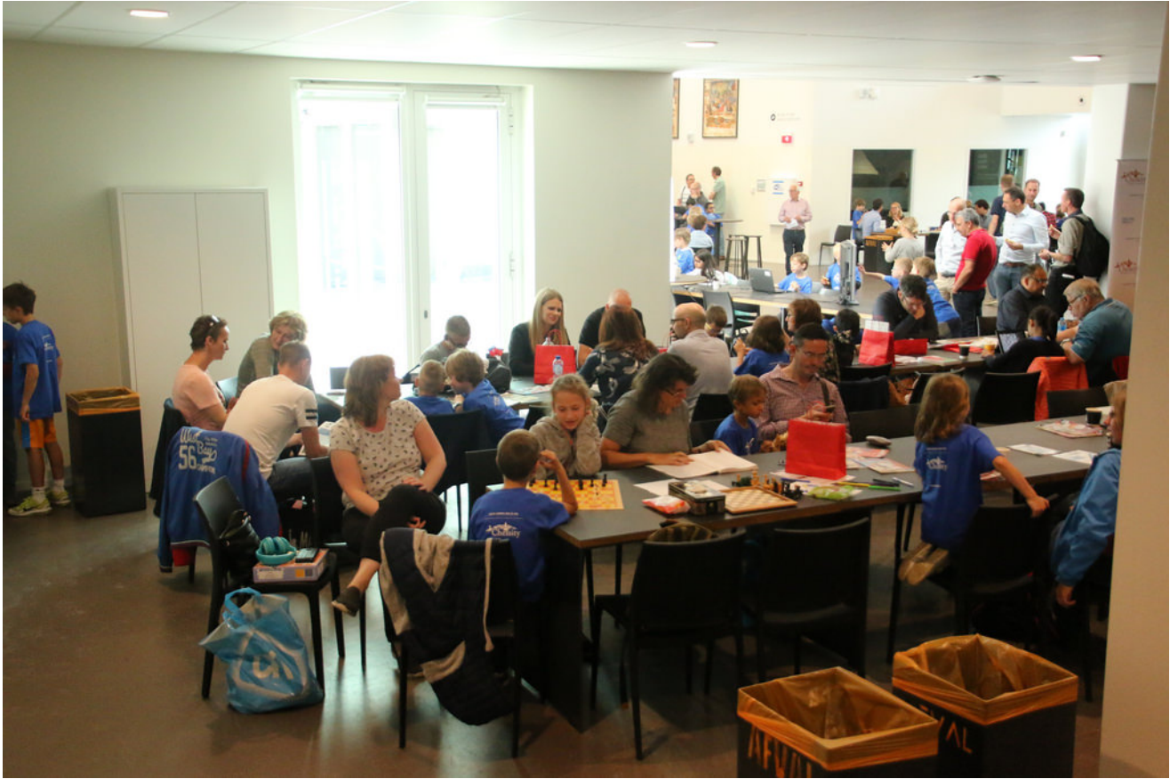
De Zeeuwse hoek